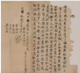
帰還時に韓国人から泊の浜で渡された礼状(内外海村長宛/大谷家蔵)