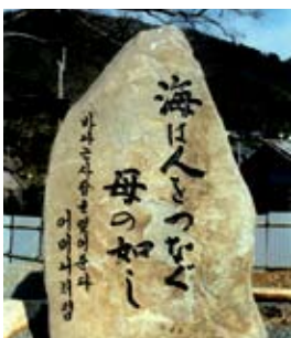
韓国船救護100周年を記念して建てられた石碑(建立当時の写真/小浜市泊海岸)